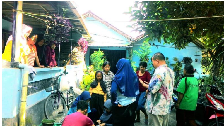
Gb. 3. Proses pencampuran warna