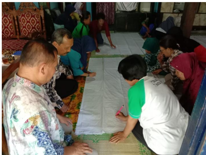
Gb. 2. Instruktur (Tim PPM UNY) mendampingi Ibu-ibu PKK sedang menentukan posisi motif pada kain