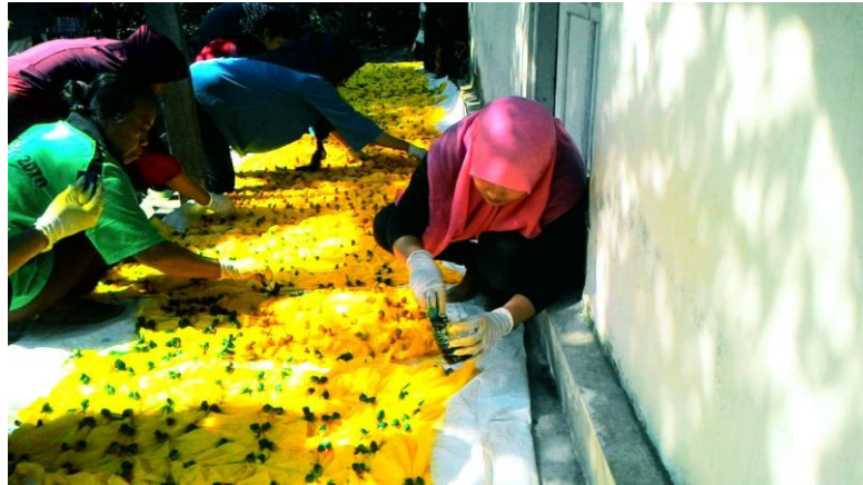
Gb. 6. Pewarnaan Kain