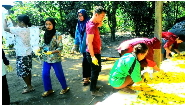
Gb. 4. Pewarnaan Kain