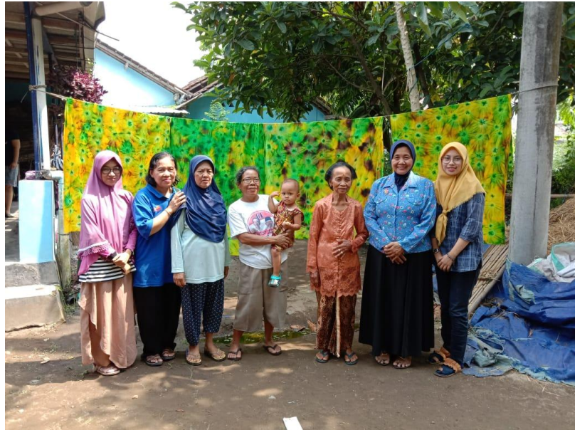
Gb. 7. Ibu-ibu sedang berfoto di depan karyanya

Setelah pengisian warna dianggap cukup maka langkah selanjutnya adalah mengangin-anginkan kain atau menjemur kain agar warna yang telah digoreskan agak kering (lembab). Selanjutnya adalah penguncian warna, bahan yang dipakai dalam pengunci warna ini adalah waterglas. Proses ini dapat dilakukan dengan cara dikuaskan dan juga mencelupkan kain ke dalam larutan waterglas.