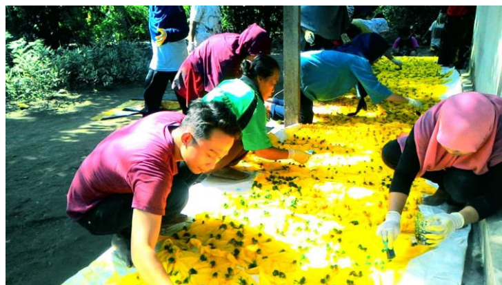
Gb. 5. Pewarnaan Kain