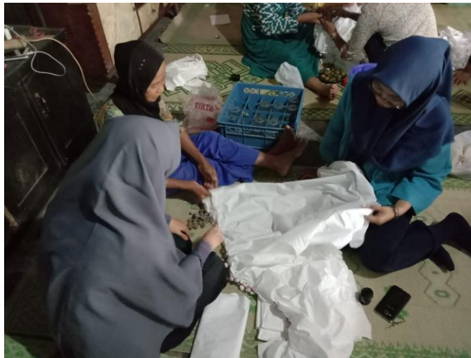
Gb. 1. Ibu-ibu PKK sedang pemasangan batu untuk motif

Pelatihan diawali diskusi dengan Ibu-Ibu PKK RT 01, RW 17 Desa Malang, Caturharjo Sleman Yogyakarta sebanyak 20 orang. Memberi penjelasan menyangkut bahan, alat, dan proses kerja batik, dilanjutkan proses awal.